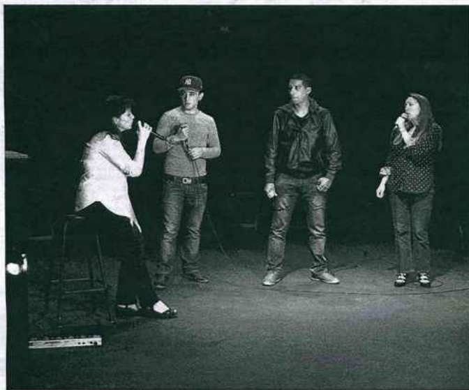
Répétitions, hier au théâtre de Lenche.