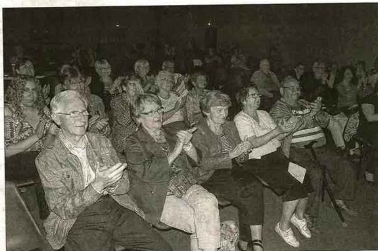
■ Plus de 100 ans après, les spectateurs ont applaudi les refrains d'Yvette Guilbert.